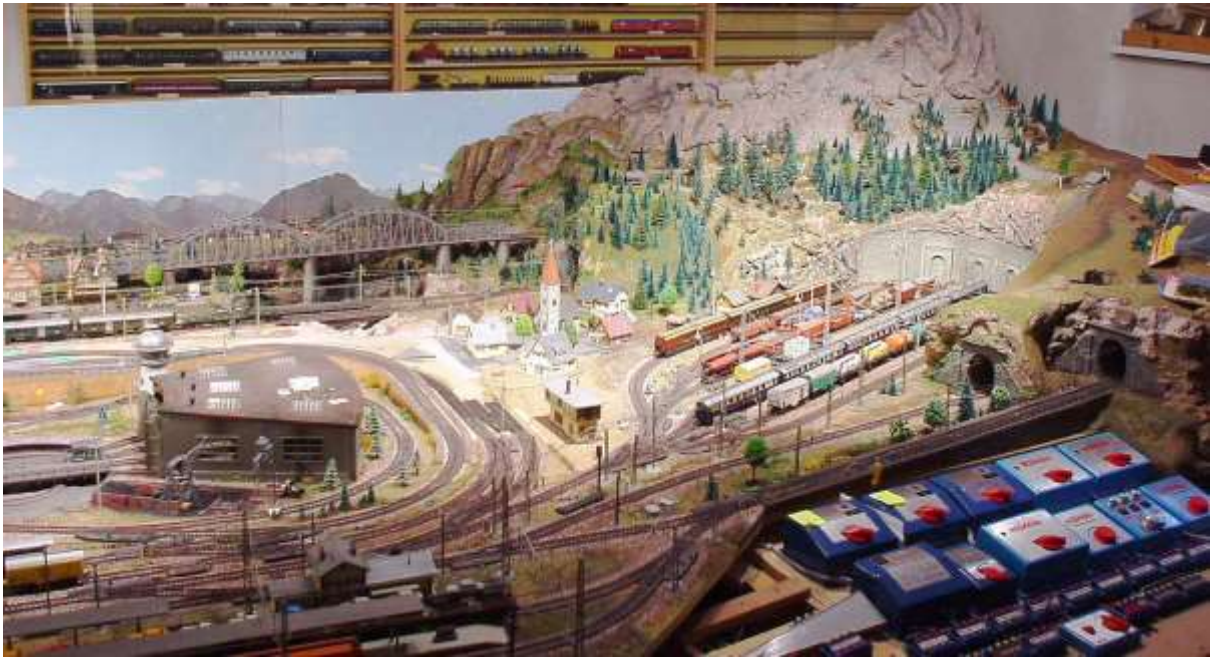
rechte Teil der Anlage mit den alten Trafos und Tunneleinfahrten