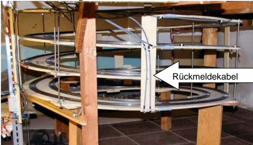
Gleiswendel mit zwei Gleistrassen